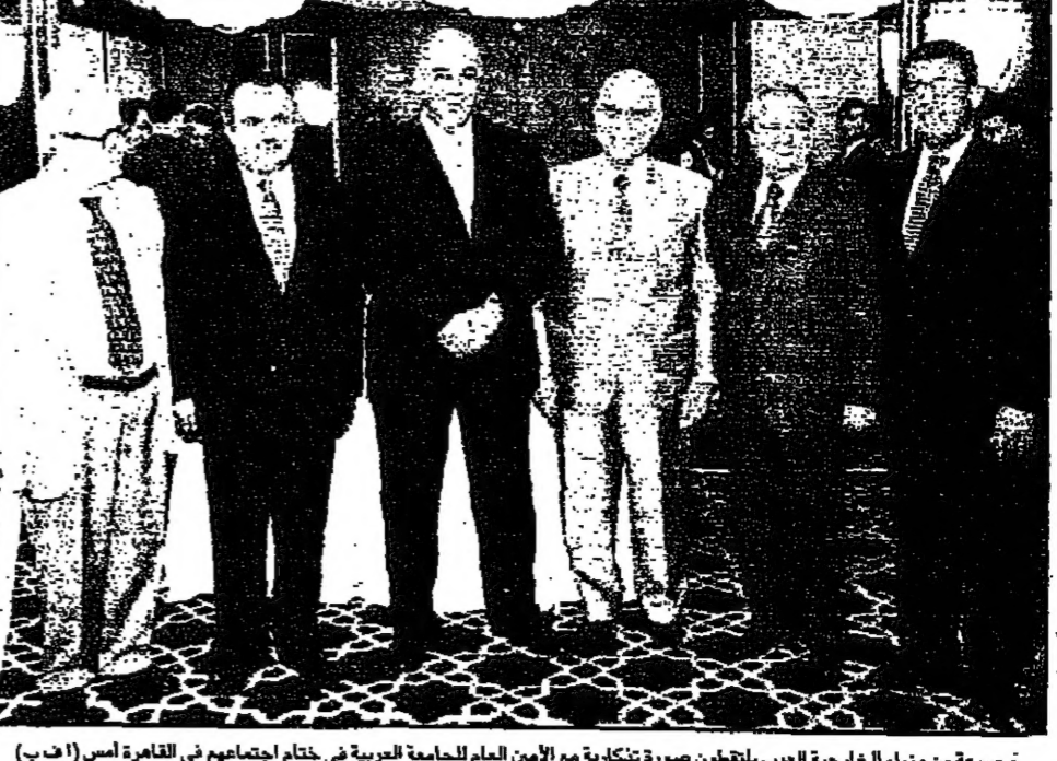
تجموعه مع وزراء الخارجية العرب يظلمون صورة تشكيلية مع الأمين العام للجامعة العربية في ختام اجتماعهم في القاهرة أمس